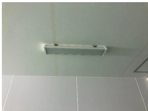
裏側配線で天井密着式仕様