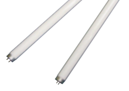
●LED蛍光灯2本 ●蛍光灯用ソケット2ヶ ●プラグ1ヶ ●コード1m×2本

業務用・工場や事務所など、従来の2本用電灯をご利用の方におすすめです 従来の蛍光灯器具の配線を変えるだけで使用できます。まず、このキットでLED蛍光灯の仕組みを御理解いただき、合わせて配線の変更をお願いします。配線変更後は安定器は不要になります。配線に関しては、当社HPまたはご連絡ください。