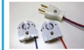
●LED蛍光灯1本 ●蛍光灯用ソケット2ヶ ●プラグ1ヶ ●コード1m×2本

まずは使いたい!という方に ネジ止めできるところでも取付けて試せます かんたんプラグセットは、100V用コンセントに差すだけでご利用いただけます。ソケットは市販のネジで固定できますので、天井、壁やディスプレイなどネジ止めできるところならどこでも取付、お試しできます。