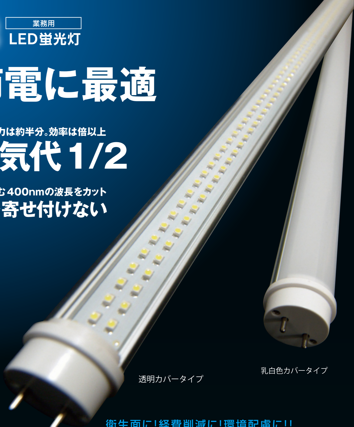
透明カバータイプ